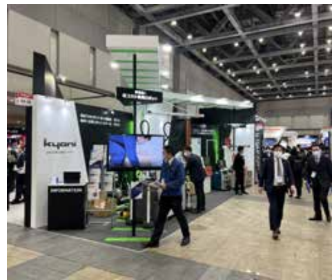
前回(第7回ロボデックス)当社ブース