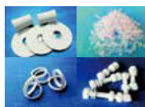
加工部品（バルブ部品、 パッキン、ねじ）

樹脂製品サプライヤーです。PTFE、PFA、PCTFEなどの原料ペレットを棒材・角材などの任意の形状に成型します。成型した材料を加工前製品と機械加工済の完成品としての両方で供給が可能です。2023年3月には全棟クリーンルーム仕様の新工場が稼働し生産能力と製品品質が向上します。