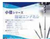
小径エンドミル シリーズ