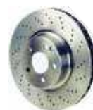
ブレーキディスク加工