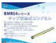
チップ交換式 エンドミル BMR04シリーズ