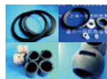
加工部品（カーボン樹脂製 品など）

今回、JIMTOFでご紹介した製品以外でも多数の中国調達製品を取り扱っております。コストダウンや他のお困りごとでお役に立てればと存じます。何でもお気軽に京二へお問い合わせください。