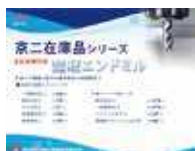
京二在庫品 エンドミルシリーズ

期間中、『株洲工具／ソリッドエンドミル』『株洲工具／チップ式ボールエンドミル』『SAIY／ダイヤモンド・CBN砥石』などが特にお客様から高い関心を頂きました。ソリッドエンドミルは小径エンドミルの質問を多く頂きました。今後も需要が拡大していく分野ですので当社も力を入れていきたいと思っております。チップ式ボールエンドミルは従来の直刃に加えスパイラル刃が発売されました。金型加工のお客様より多くの問い合わせを頂きました。